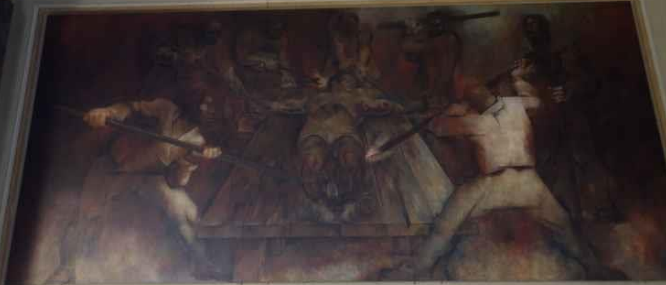
THE LAST SUPPER BY CARAVAGGIO 1590-1591